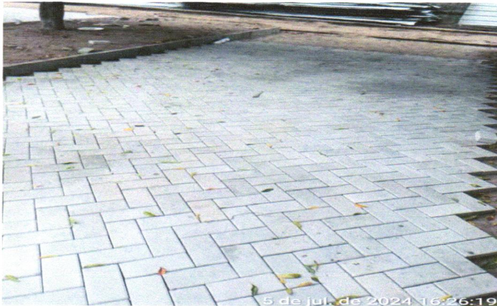
FOTO 04: Pavimentação em bloco de concreto vibroprensado, intertravado, colorido, 10x20cm, e=6cm, 46un/m2, NBR9781, Fck(min)=35MPa, sob coxim areia grossa compactada c/ placa vibratória, e(comp.)=6cm, rejuntado c/ areia fina

FOTO 03 : Pavimentação em bloco de concreto vibroprensado, intertravado, cor natural, 10x20cm, e=6cm, 46un/m2, NBR9781, Fck(min)=35MPa, sob coxim areia grossa compactada c/ placa vibratória, e(comp.)=6cm, rejuntado c/ areia fina