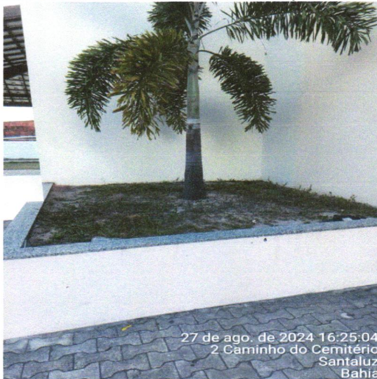
FOTO 08: FORNECIMENTO E PLANTIO DE VEGETAÇÃO ORNAMENTAL AF_11/2017